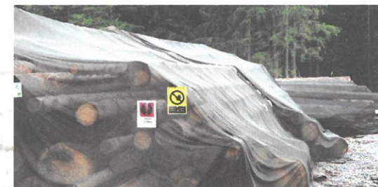
Ochrana skládek pomocí insekticidních sítí.

Asanační metoda odvozem napadeného dříví z lesa byla zavedena v 80. letech, kdy následovalo v průběhu několika dní zpracování, jehož součástí bylo většinou i odkornění. V nedávné době byla tato metoda „modifikována“ na odvoz za hranice lesa, kde lýkožrout dokončil svůj vývoj a „vrátil se“ do lesa, kde napadl další stromy. Toto je proto v současné době zakázáno. Aktivní kůrovcové dříví musí být asanováno!