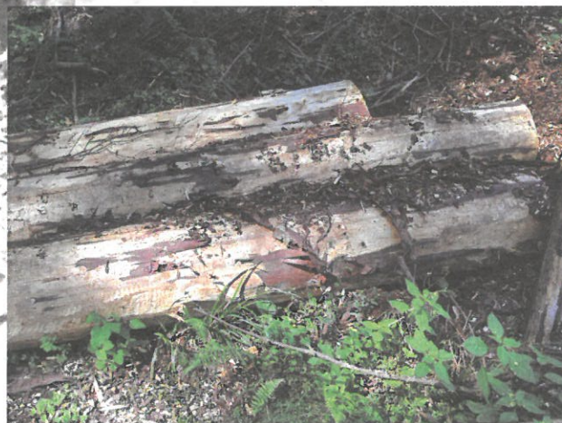
Asanace pomocí odkornění.

Ruční odkorňování je velice účinné (nelze jej ale použít ve stádiu žlutého brouka s výjimkou odkorňovacích adaptérů na motorovou pilu). Oloupání kůry z pokáceného kmene v malém množství nevyžaduje pro fyzicky zdatného vlastníka zásadní náklady, kromě investice do vlastního času a často je pro drobného vlastníka lesů jedinou dostupnou metodou. Chemická asanace nemá z hlediska vývojového stádia omezení, výkon je vyšší, ale pro drobného majitele lesa existují omezení v zajištění přípravků pro chemickou asanaci. Alternativou je odkorňování pomocí adapterů na motorovou pilu, ale je třeba vlastní pilu s odpovídajícími parametry.