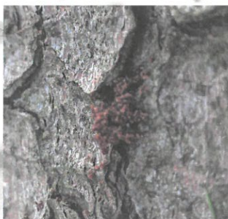
Dratinky na patě stromu.

Včasná asanace napadených stromů s využitím všech dostupných metod zabrání nebo omezí napadení dalších stromů a tím se vynaložené náklady vrátí. Je nutné brát v potaz omezení jednotlivých metod a zohlednit je pro konkrétní situaci.