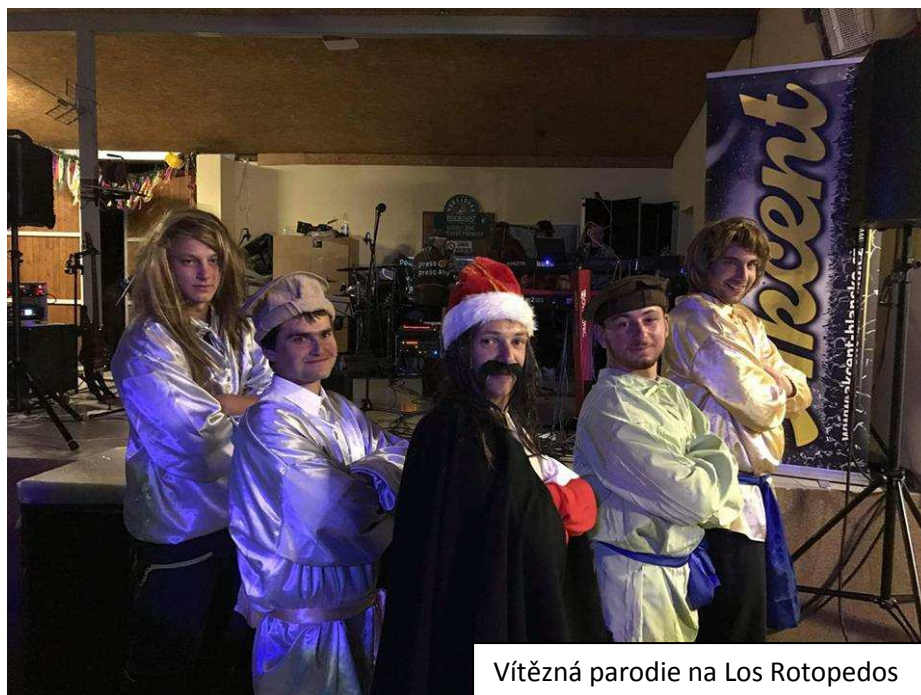
Vítězná parodie na Los Rotopedos