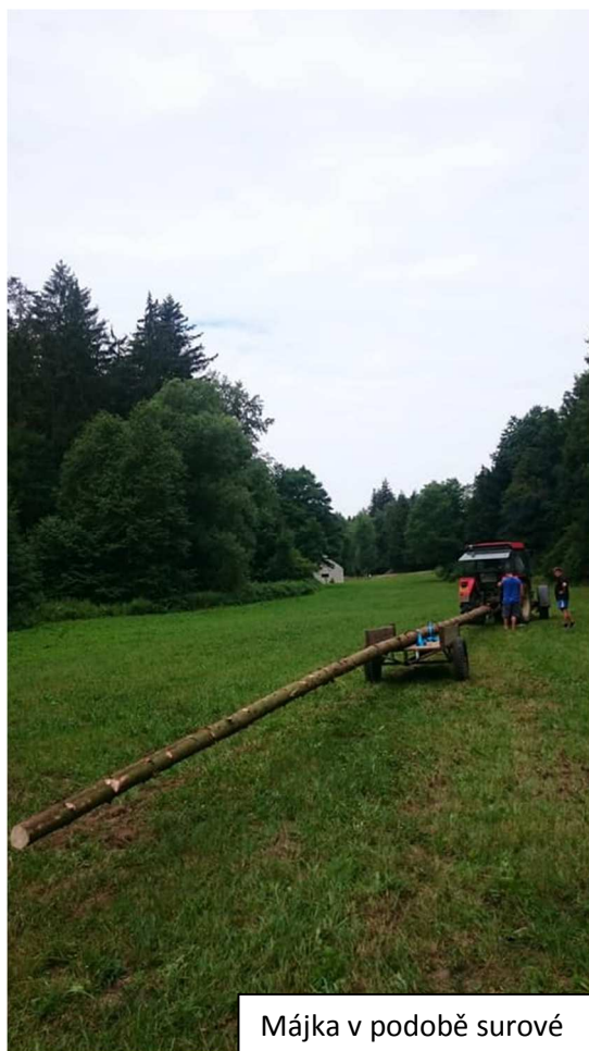
Májka v podobě surové