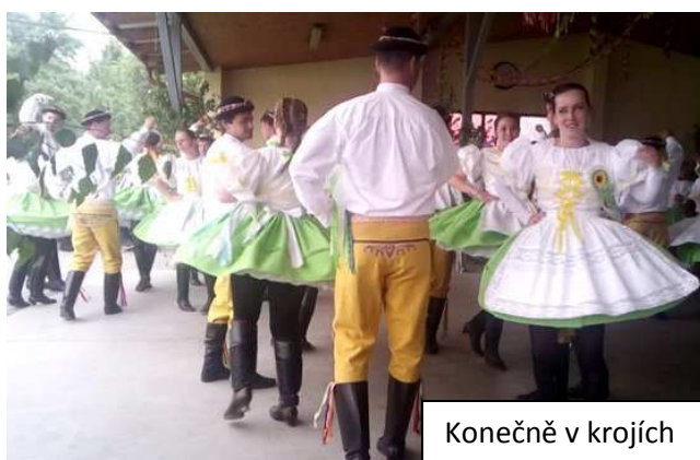
Konečně v krojích